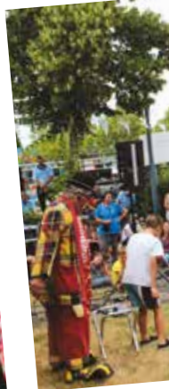
Poneys, trottinettes, voitures à pédales : du tout terrain pour les hestayres bien préparés.