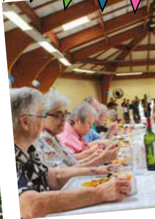
Il a fallu aussi: bien se tenir à table, écarter de valeureuses cornues et taquiner le goujon...un travail à plein temps.