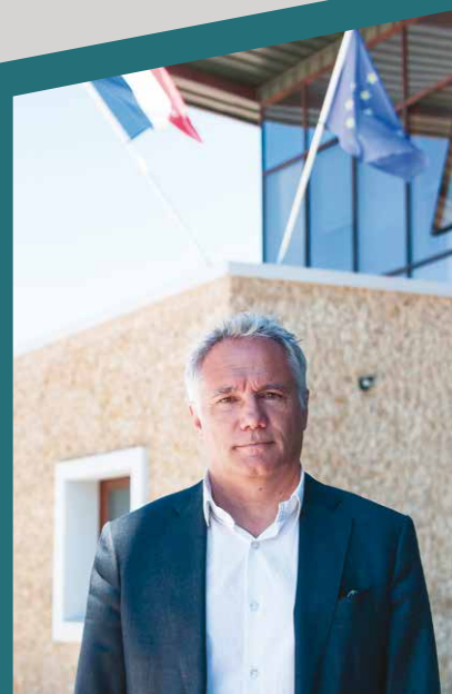
Joël BONNET, Maire Vice-président à Mont-de-Marsan Agglomération en charge de l'attractivité économique et touristique et du Développement économique

Comme tous les six ans, en 2020, a eu lieu le renouvellement des conseils municipaux et des conseils communautaires des intercommunalités (agglomérations). Si le premier tour a eu lieu, comme prévu le 15 mars, le second tour, prévu le 22 mars, fut reporté au 28 juin en raison de la pandémie Covid 19. Pour Saint-Pierre-du-Mont, le nombre d'habitants étant juste au-dessous de 10000, le conseil municipal est composé de 29 élus avec, parmi eux, 8 conseillers communautaires, en respectant la parité femmes/hommes. Dans ce trombinoscope, l'indication «Délégué(e) communautaire» est portée sous chaque candidat (e) récemment élu (e) à cette assemblée.