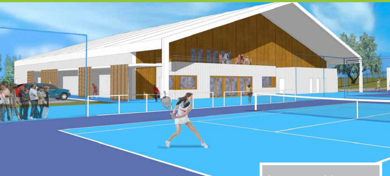
Vue générale du complexe tennistique.