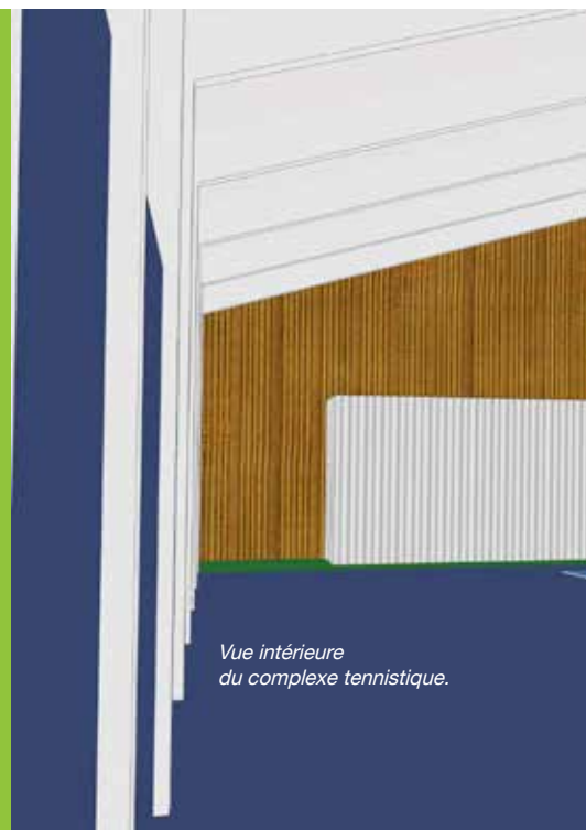
Vue intérieure du complexe tennistique.

L'ensemble des aménagements (clôture, accès, terrasse, gradins...) privilégie la visibilité et le confort des spectateurs. »