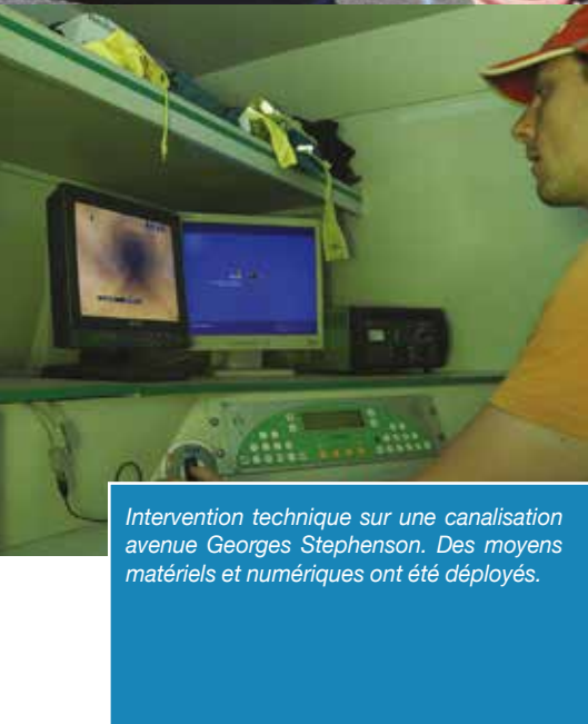
Intervention technique sur une canalisation avenue Georges Stephenson. Des moyens matériels et numériques ont été déployés.