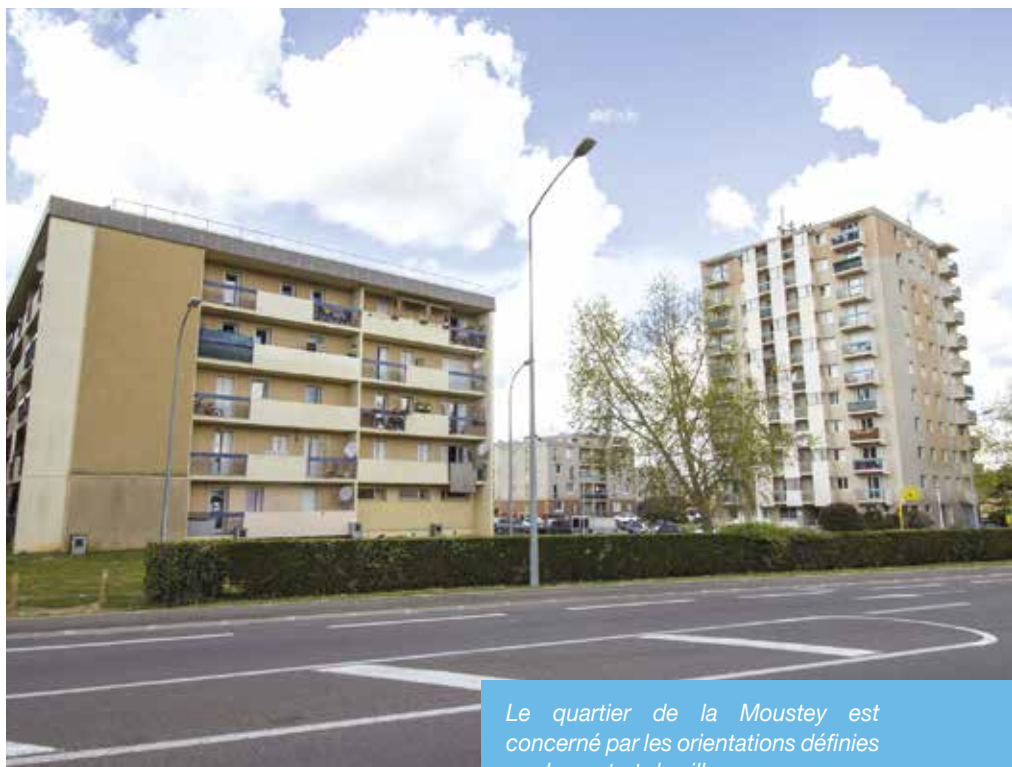
Le quartier de la Moustey est concerné par les orientations définies par le contrat de ville.

C'est une politique mise en place par les pouvoirs publics afin de revaloriser des zones urbaines appelées « quartiers prioritaires » souvent touchés par des difficultés cumulées nécessitant l'intervention et la mobilisation de tous les acteurs en matière de développement économique, cadre de vie, cohésion sociale, culture, santé. La mise en œuvre de la politique de la ville passe par la signature d'un Contrat de ville, qui a réuni l'Etat représenté par le Préfet de département, le Président de Mont de Marsan Agglomération, le Maire de Saint-Pierre-du-Mont.