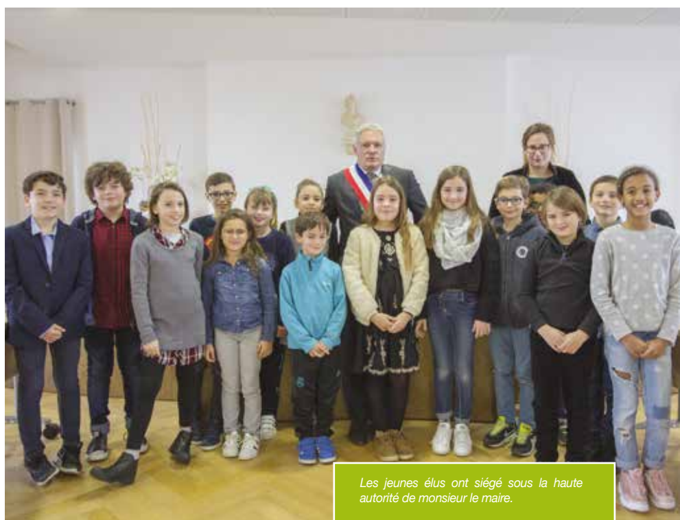
Les jeunes élus ont siégé sous la haute autorité de monsieur le maire.

Les jeunes élus qui ont choisi de s'engager pour la commune de Saint-Pierre-du-Mont franchissent une à une les étapes nécessaires pour appréhender leur mandature naissante. La 1 ère assemblée plénière et la présentation des jeunes au conseil municipal des « grands » ont marqué le calendrier citoyen saint-pierrois du premier trimestre 2019.