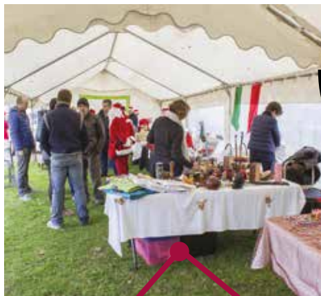
Le marché de Noël

Le Noël des enfants de la commune l'atelier vannerie