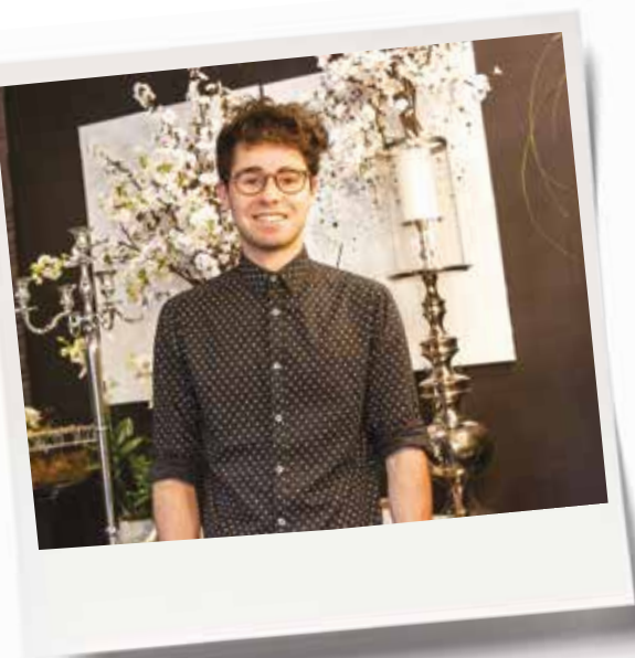
Histoire de fleur artisan créateur, 65 avenue Camille Brettes Saint-Pierre-du-Mont 05 58 46 25 03