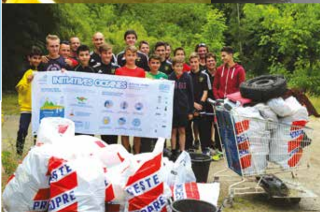
La section Kayak de la ville, Surfrider Foundation Europe et les agents de l'Agglo ont procédé au ramassage et au tri de ces déchets. Une belle initiative qui a permis de récolter : 217 bouteilles plastiques, 49 bouteilles en verre, 55 cannettes en métal, 54 Gobelets jetables, 2 licornes, 2 canards en plastique et 1 toucan !