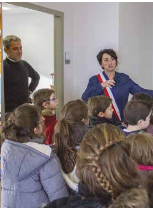
Les élèves ont été accueillis et informés par les élus