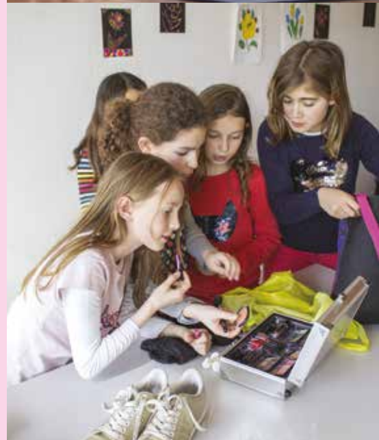
Grâce à l'atelier cirque, les élèves des classes primaires proposent de petits spectacles aux résidents de l'Ehpad