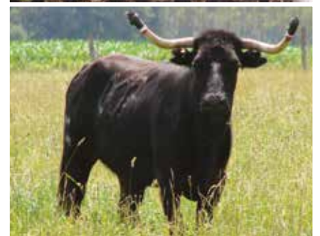
Les vaches protagonistes de la course landaise, sont également appelées «coursières»