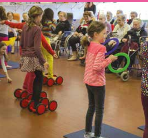
Des enfants fiers de leurs productions