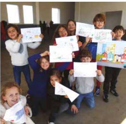
La ville de demain par les enfants.