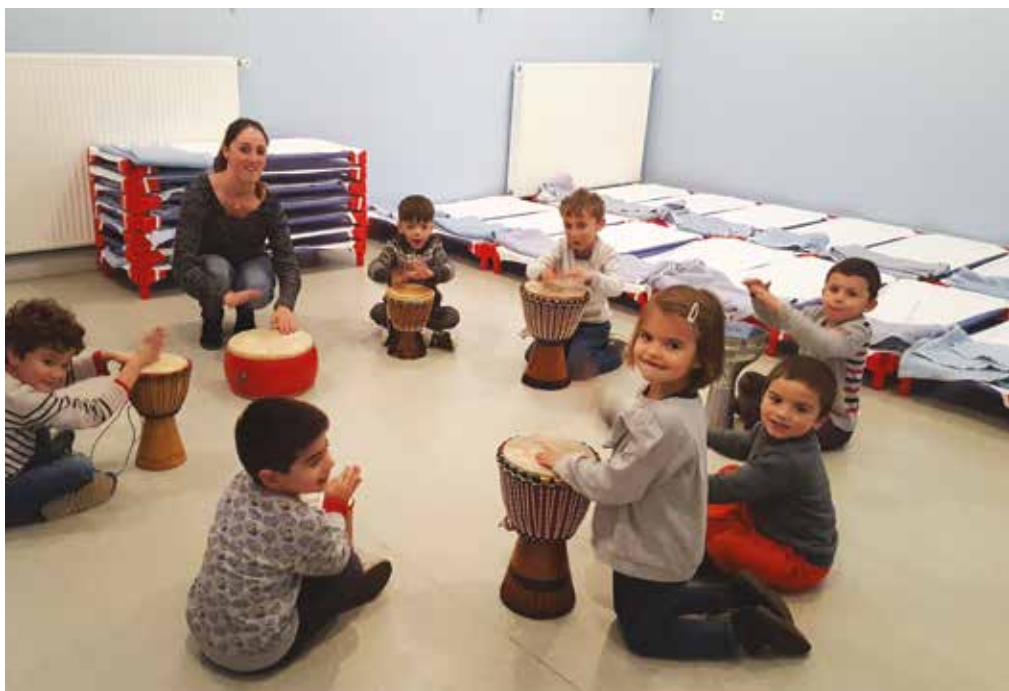
Les élèves des classes maternelles de l'école Jules Ferry adorent l'atelier Djembé

À Saint-Pierre-du-Mont, le choix des élus s'est porté sur le maintien de la semaine de 4,5 jours dans les écoles. Consultations, retours d'expérience, réflexions, discussions : la décision finale est le fruit d'un travail concerté