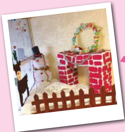
Les élèves de l'école Mistral ont réalisé de nombreuses décorations pour leur école.

Une étude du Ministère de l'Éducation nationale révèle également que la mise en place des TAP a permis à plus d'un tiers des enfants de découvrir et pratiquer de nouvelles activités.