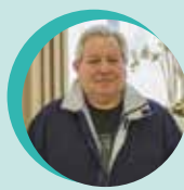
Quartier jaune Jean Fauthoux