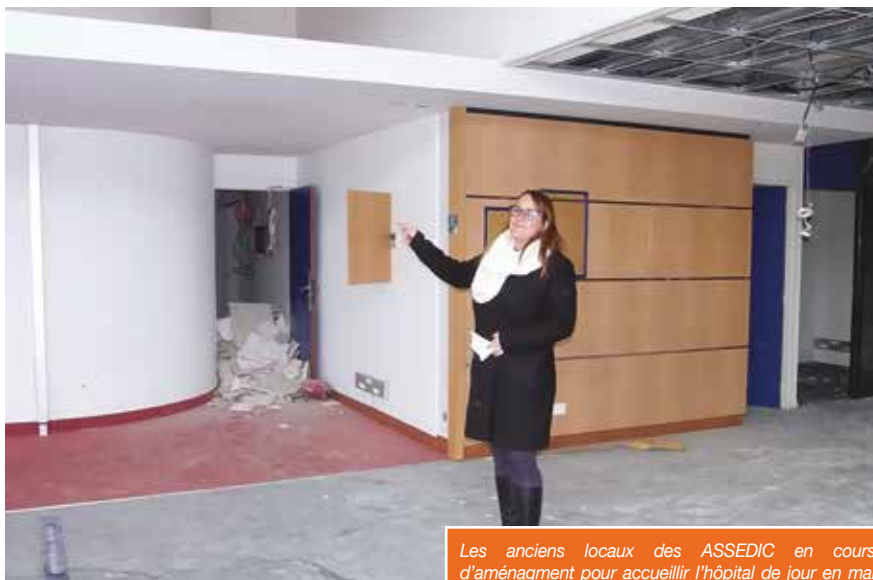
Les anciens locaux des ASSEDEC en cours d'aménagement pour accueillir l'hôpital de jour en mai 2018.

Par rapport à l'accessibilité offerte aux patients, aux véhicules et à l'attractivité de la ville. Il y avait des autorisations disponibles auprès de l'Agence Régionale de Santé pour développer la psychiatrie en ambulatoire. La stratégie générale sur le territoire prévoyait d'ouvrir une unité à Dax. En collaboration étroite avec le Centre hospitalier de Mont-de-Marsan, et l'unité de Saint-Anne, on a ainsi décidé