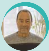
Quartier bleu François Platel