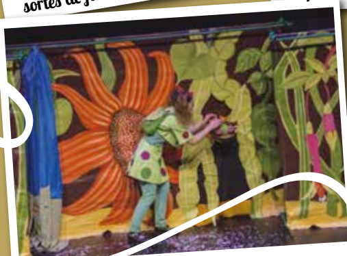
Le spectacle «Noémie et le mystère de la chrysalide» a été présenté.