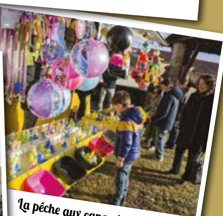
La pêche aux canards se pratique en toutes saisons