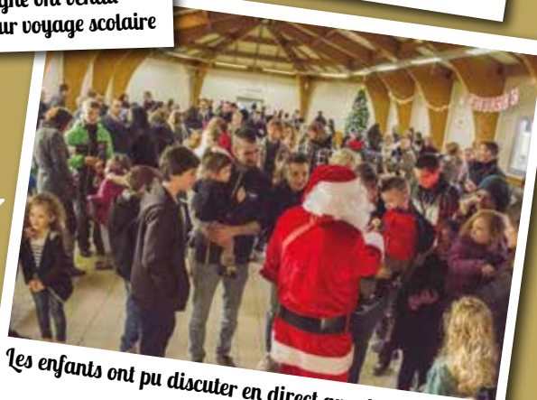
Les enfants ont pu discuter en direct avec le père Noël