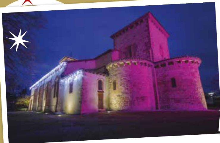
L'église a revêtu son habit de lumière

Les Saint-Pierrois ont profité de la période des fêtes pour rencontrer le père Noël et participer à différentes animations