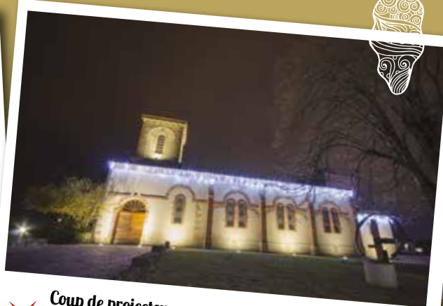
Coup de projecteur sur les illuminations de Noël