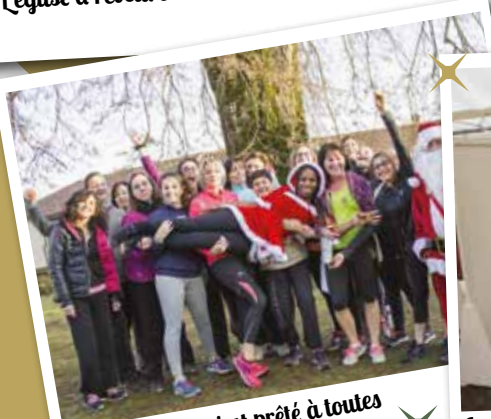
Le père Noël s'est prêté à toutes sortes de facéties