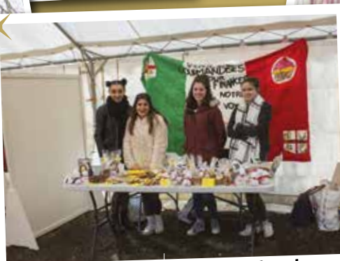
Les élèves du lycée Jean Cassaigne ont vendu des pâtisseries pour financer leur voyage scolaire