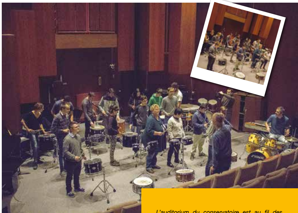
L'auditorium du conservatoire est au fil des séances, devenu la salle de jeu préférée des jeunes musiciens.

Cette année, un groupe de jeunes de l'IME St Exupéry de notre commune a été choisi pour participer à un PEAC, en partenariat avec le conservatoire des Landes afin de rentrer dans l'univers de la musique et plus précisément des percussions. Depuis novembre 2017, et ceci pendant 3 mois à raison d'une fois par semaine, ces jeunes de 14 à 17 ans retrouvent