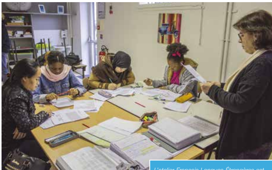
L'atelier Français Langues Étrangères est très fréquenté.

S. Lapeyre : Oui, c'est un atelier participatif. Nous avons tout d'abord cherché un lieu où les jeunes pourraient se retrouver et s'occuper en réparant des vélos. Puis on a créé l'atelier. Le principe est simple : on récupère des vélos (le Conseil Départemental