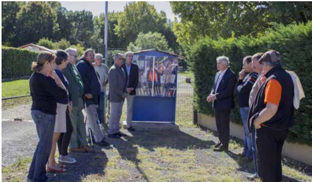
Depuis quelques mois les quartiers s'animent : fête de quartier, boîte à livres...

Les Conseils de quartier ont été créés à Saint-Pierre-du-Mont en 2014, dans l'objectif de permettre aux citoyens de réaliser des projets d'aménagements, d'animations et de faire remonter les attentes des administrés à l'équipe municipale afin d'améliorer le cadre de vie de leur quartier. Ces Conseils de quartier seront renouvelés en fin d'année.