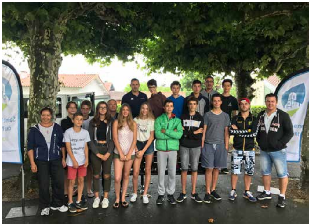
Le départ des Ados pour Bombannes.

Les "Séjours Ados" sont organisés par le service des sports dans le cadre du programme Landes Imaginations, depuis quatre ans à Saint-Pierre-du-Mont. Du 10 au 14 juillet 2017, 14 jeunes ont profité de ces vacances sportives et culturelles. De retour à Saint-Pierre-du-Mont, les jeunes et leurs encadrants ont souhaité témoigner de cette expérience riche en aventures et en échanges.