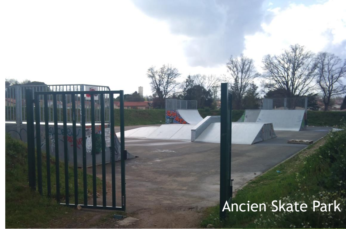
Ancien Skate Park

Cet équipement vieillissant, obsolète et devenu quasi impraticable, a été déposé en 2016 lors de la construction du complexe tennistique Jean AUDOUIN; Les éléments anciens, positionnés sur un espace trop restreint et en marge des autres équipements, ne répondaient plus de façon cohérente aux besoins.