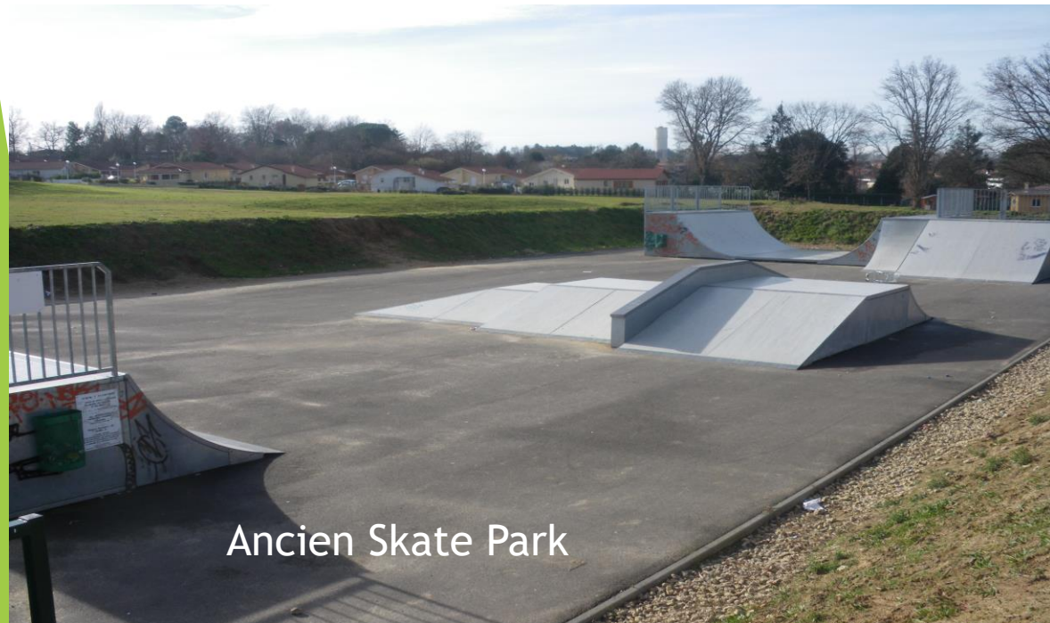
Ancien Skate Park

les espaces roulants entre chaque module étaient très limités et contraires aux principes fondamentaux du roller et de la trottinette ; le bois avait travaillé, s'était ramolli et devenait dangereux.