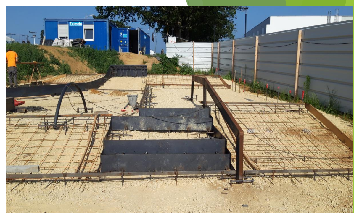
Photos de chantier